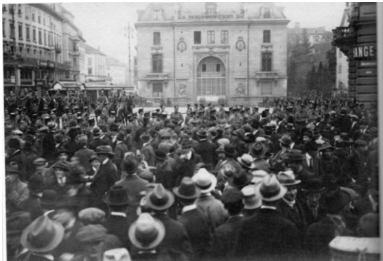
Ordnungsdienst-Truppen sperren die Eingänge der Banken am Paradeplatz ab (Gretler's Panoptikum)